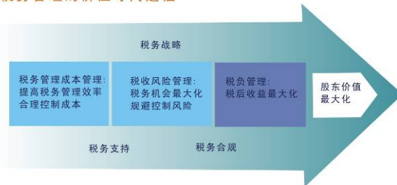
税务管理的价值导向过程

正坤从税务风险管理、税务成本管理、税务内控管理几大方面，真正实现企业管理绩效控制，最终为企业实现最大价值。